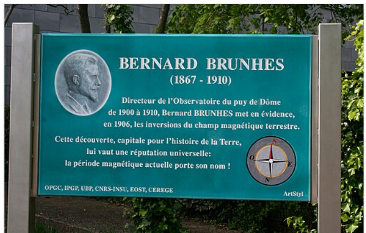
Plaque commémorative du centenaire de la découverte par Bernard Brunhes des inversions du champ magnétique terrestre . Cette plaque en lave émaillée se trouve devant l'entrée de l' Observatoire de physique du globe de Clermont-Ferrand (OPGC).

Dans le passé géologique se sont succédé diverses « périodes » au cours desquelles le champ magnétique a gardé une même polarité, non pas tout le temps (chaque période d'une certaine polarité est interrompue par de courts « événements » de l'autre polarité) mais la plupart du temps. Ainsi nous vivons depuis 780 000 ans une période dite normale, qu'on a appelée période de Brunhes 18 . Auparavant c'était une période inverse (c.-à-d. de polarité inverse) qui avait débuté il y a 2,48 Ma, et qu'on a appelée période de Matuyama (l'inversion conduisant de celle-ci à celle-là est logiquement nommée inversion Brunhes-Matuyama ). Auparavant encore, la période (normale) de Gauss , etc. Quant à la polarité inverse découverte par Bernard Brunhes à Pontfavein, qui a récemment été réétudiée (et confirmée) 19 , elle date de 6,16 \pm 0,08 Ma (et donc du miocène ).