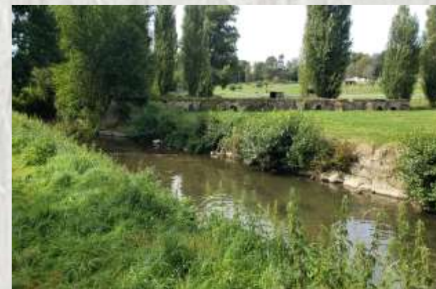
Ozouer-le-Voulgis – L'Yerres près du village

Une agréable petite randonnée autour d'un village installé sur un coteau de l'Yerres. Après avoir vu des champs, le village sous différents angles vous traversez un bois où subsistent de nombreuses traces d'exploitation de carrières.