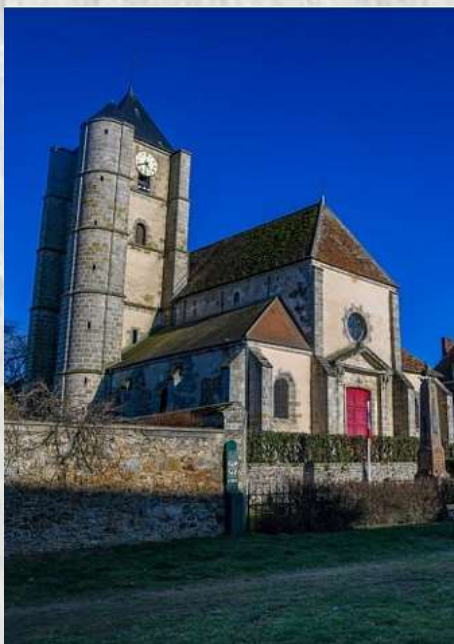
Ozouer-le-Voulgis : Eglise Saint-Martin

L'imposante église Saint-Martin à Ozouer-le-Voulgis, inscrite au Monuments Historiques depuis 1926, est un édifice de style Renaissance bâti vers 1530-1540 et remanié au début du 18e siècle qui abrite de nombreux objets d'art.