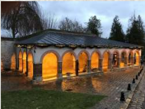
Ozouer-le-Voulgis : lavoir du Bourg

Le balisage de l'itinéraire que vous empruntez est réalisé et entretenu par les 250 baliseurs du comité départemental de la Randonnée Pédestre de Seine-et-Marne (Codérando 77). Il fait partie des 4500 km de chemins de promenade et de randonnée existant sur le département.