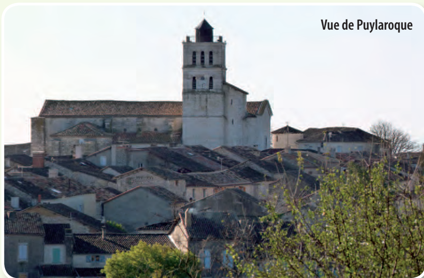
Vue de Puylaroque

■ Descendez vers le village et suivez la D17 puis prenez la petite route à droite direction «Millet», face aux écoles (descente jusqu'à la D20).