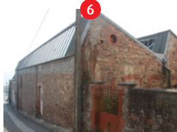
Anciennes usines (Mollon)