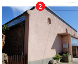
Atelier de Ghimi