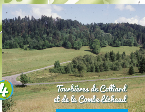
Tourbières de Colliard et de la Combe Léchaud