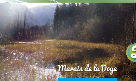
Marais de la Doye