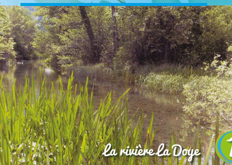
La rivière La Doye

Le Haut Bugey s'étend entre la Cluse de Nantua à Bellegarde au Nord et les Cluses de l'Albarine et des hôpitaux au sud. De par son caractère karstique, la circulation de l'eau est avant tout souterraine excepté aux Neyrolles, village aux sept fontaines en pierre de taille où les sources sont nombreuses !