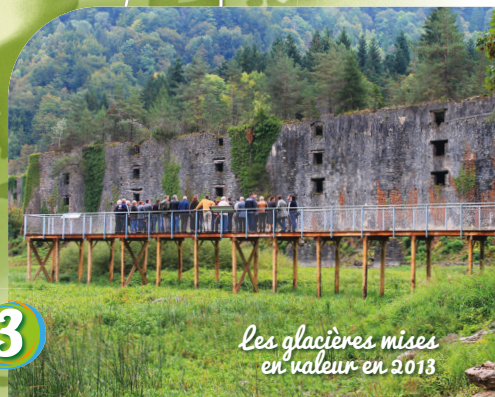
Les glacières mises en valeur en 2013

Vous êtes ici Départ parking aire d'accueil