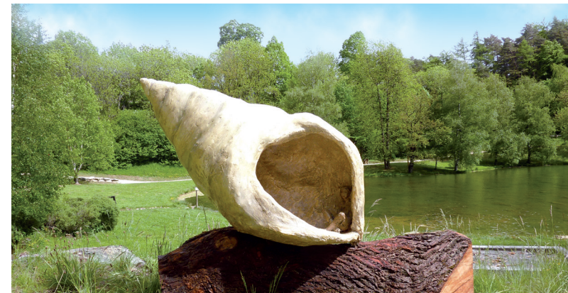
"Ecoute la musique de la mer" par Eléonor Stride