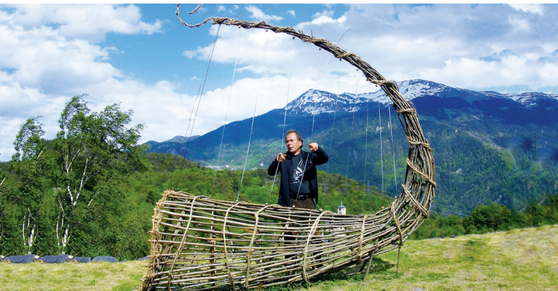
"La lyre D'Eole" par Pierre Callon