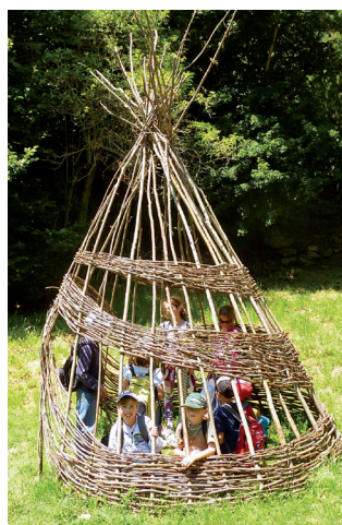
"Ceci n'est pas un tipi" par Claire Boucl

Si le Land'art propose des œuvres extrêmement éphémères, au contraire les créations d'art In Situ, comme celles qui émaillent le site de Hautecour, se colorent au fil des saisons, se patinent et s'érodent quelquefois pendant de longs mois avant de disparaître... Œuvres intemporelles, elles laisseront à certains le souvenir impérissable d'une photographie.