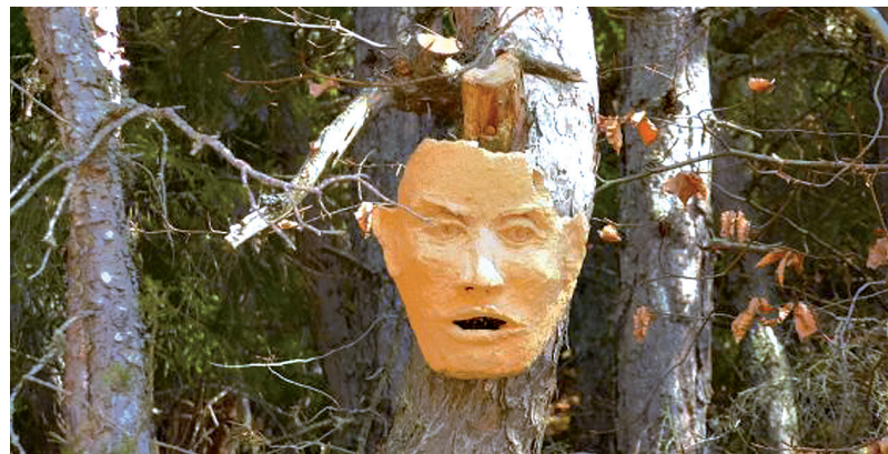
"La voix de la forêt" par Mireille Belle