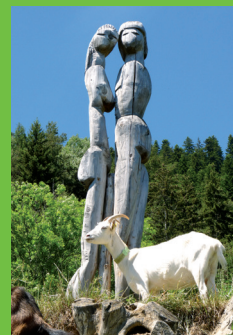
"Tot'aime" par Hugues Grammont