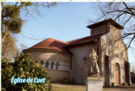
Église de Cuet

ATTENTION ! Traversée de la RD 28 en deux endroits.