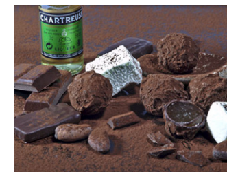
Chocolaterie Sandrine Chappaz