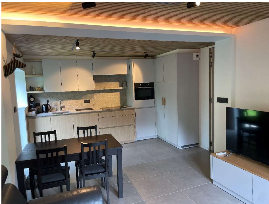
Table à manger pour 6 personnes

Cuisine spacieuse et hyper équipé avec plaque de cuisson à induction, grand frigo-congélateur, four combiné avec micro-ondes, lave-vaisselle, cafetière Senseo, grille-pain, bouilloire,