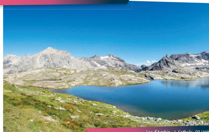
Lac d'Ambin

Votre âme d'aventurier vous incitera peut-être à prolonger le plaisir par une nuit au bivouac Walter Blais.