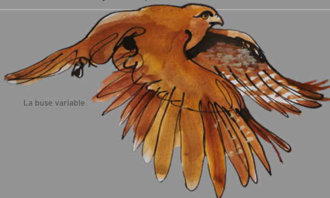
La buse variable