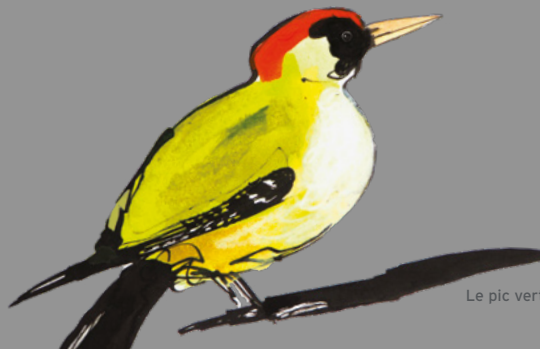
Le pic vert

Philippe Manoury, Partita II , pour violon et électronique en temps réel