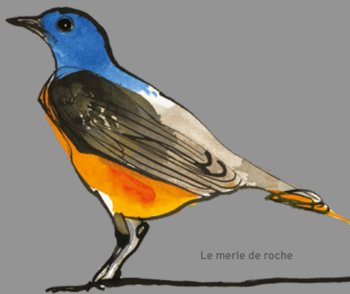
Le merle de roche

Ainsi, pour revenir aux sources de Messiaen, cette édition est consacrée aux oiseaux. Mais il ne s'agit pas d'un thème seulement mais d'une dédicace, d'un engagement, d'une prière : Pour les oiseaux .