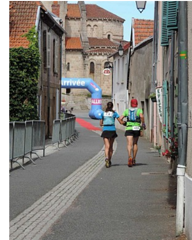
Mairie de Châtel-Montagne