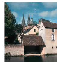
Cœur de ville