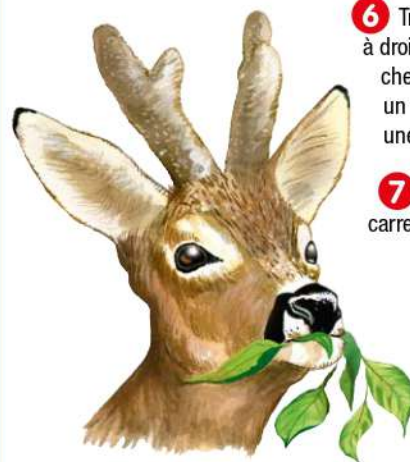
CHEVREUIL / DESSIN PP.

7 Prendre à gauche et rejoindre le carrefour des Vieilles-Ventes.