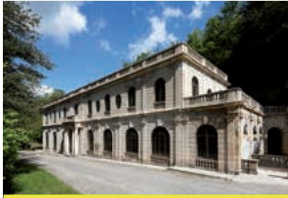
Auberge des Dauphins (Saoû)

dans les lacets du dernier kilomètre. La descente vers Aouste est très belle, avec notamment le ruisseau et le Pas de Lauzens, échancrure s'ouvrant sur la vallée de la Drôme. À peine arrivé en bas, il faut remonter en direction de La Répara, par une petite route qui serpente dans les coteaux secs. Un arrêt au hameau des Lombards est alors conseillé avant de s'attaquer à la dernière petite difficulté, la montée du petit col de Lunel. D'ici, il suffit de se laisser descendre dans la vallée du Roubion.