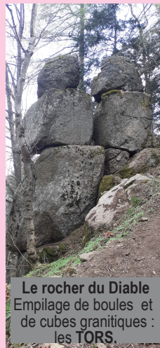
Le rocher du Diable Empilage de boules et de cubes granitiques : les TORS

Toujours soucieux de mettre en valeur les sites naturels de Ceyrat pour la découverte et le plaisir de tous, les bénévoles de l'Association Ceyrando ont voulu, par ce nouveau circuit de randonnée très sauvage, vous permettre de découvrir, à flanc de la Faille, quelques uns de ces rochers de granite aux formes très particulières. Les gorges des ruisseaux de Thèdes et de l'Artière de Boisséjour, riches en biodiversité, sont des étapes de détente et de sérénité sur ce parcours.