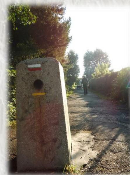
Veneux : Les venelles

Laissez-vous guider dans ce labyrinthe de venelles qui vous fera découvrir Veneux-les-Sablons comme vous ne pensiez pas le voir.