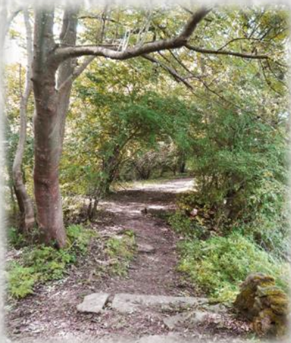
Veneux côté jardin

Si Thomery était renommée pour la culture du raisin de table, Veneux témoigne d'une longue tradition viticole. En effet, la vigne a fortement marqué le paysage de Veneux-les-Sablons, qui comptait encore près de 300 vigneron à la fin du XIXème siècle. Si les potagers et les vergers ont progressivement supplanté la vigne, un important réseau de venelles jalonnées de puits subsiste au cœur de la ville. Ces chemins bucoliques entres murs de grès et de meulière permettent de découvrir Veneux côté jardin ! Afin de faire vivre son héritage, la commune organise un grand rassemblement épicurien, « la foire aux fromages et aux vins » qui attire chaque premier week-end de septembre plus de 10 000 visiteurs.