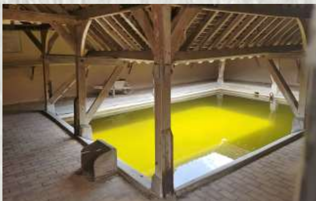
Le lavoir

Le balisage de l'itinéraire que vous empruntez est réalisé et entretenu par les 250 baliseurs du comité départemental de la Randonnée Pédestre de Seine et Marne (Codérando 77). Il fait partie des 4500 km de chemins de promenade et de randonnée existant sur le département.