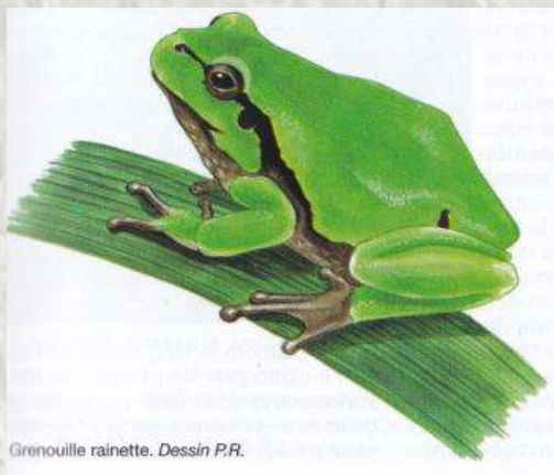
Grenouille rainette. Dessin P.R.

Au centre du bourg, se trouve un lavoir dit en impluvium, construit en 1881. A l'intérieur, deux inscriptions peintes dans un style naïf rappellent qu'il est interdit de rentrer les brouettes dans le lavoir et de mettre du linge à sécher sur les jambes de force.