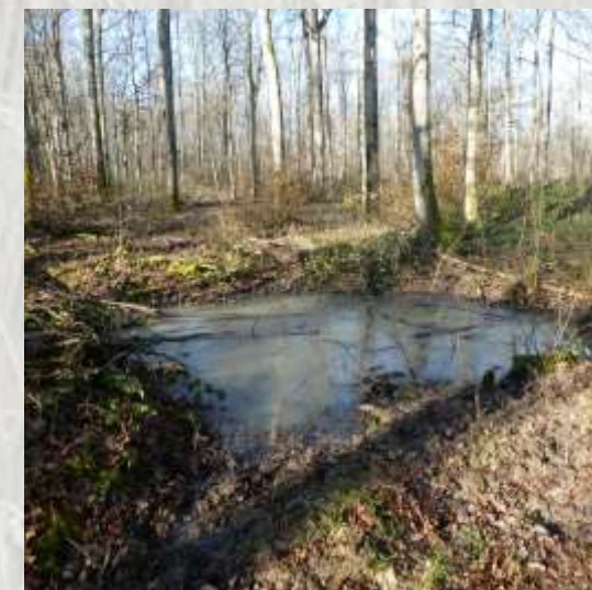
Mare près d'Echouboulain

Ce petit parcours mi-champêtre, mi forestier vous donne un aperçu des abords du massif forestier de Villefermoy, au cœur de la Brie humide, où bois et champs sont intimement imbriqués.