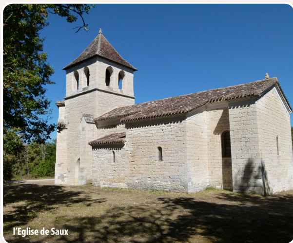
l'Eglise de Saux

■ De l'Office de Tourisme, prenez direction Cahors. Après 500 mètres tournez à gauche au Parc de Loisirs du Faillal et continuez sur la petite route