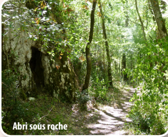
Abri sous roche