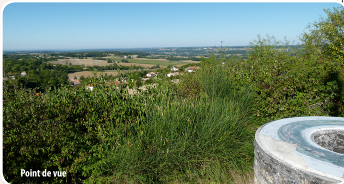
Point de vue