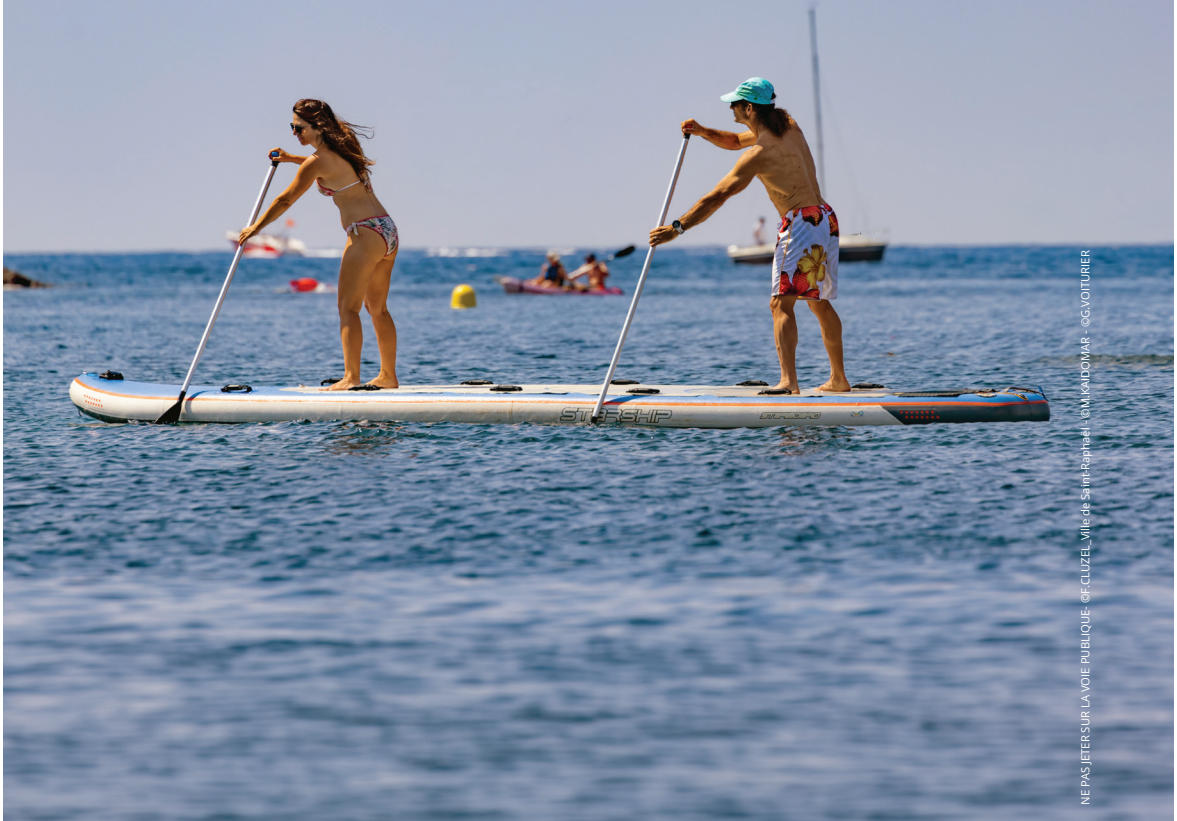
NE PAS JETER SUR LA VOIE PUBLIQUE @E-CLUZEL_Ville de Saint-Raphaël @M.MADONMAR @CSVOITURIER