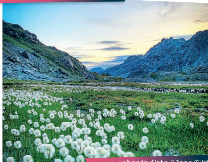
Les linaigrettes d'Ambin - B. Thomas, OT HMV

Et que dire de ces fascinants petits pompons blancs si fragiles qui bordent les lacs Perrin, plantés là comme par enchantement ? L'herbe à coton, ou linaigrette des Alpes, si caractéristique des zones humides de montagne, se laisse caresser délicatement par le vent et accapare votre regard émerveillé. Soyeuse et légère, elle mérite une photo, mais pas une cueillette. Quelle douceur au cœur de cet univers minéral !