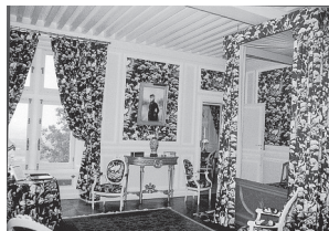
"La Chambre Bleue"

Wir bewundern eine bemerkenswerte Landschaft und ein ebensolches Panorama sowie einen hübschen, in Terrassen angelegten Park, weitläufige Wohnungen mit raffinierten Innenraumgestaltungen. Seltene Andenkensammlungen der Familie von La Fayette und des Amerikanischen Unabhängigkeitskriegs ziehen unsere Aufmerksamkeit auf sich.