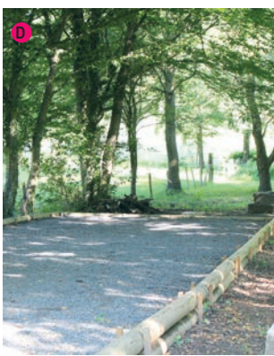
D Tables de pique-nique et terrain de pétanques.

- Rejoindre la petite route qu'il faut abandonner lorsque se présente un important virage à gauche. Partir sur la droite par un large chemin de terre qui remonte jusqu'au hameau de La Brillolle. 1 À la 1 ère ferme, prendre à gauche sur le chemin d'abord goudronné puis seulement empierré qui amène à la route de Meys / Grezieu-le-Marché. Remonter cette route à droite. ⚠️