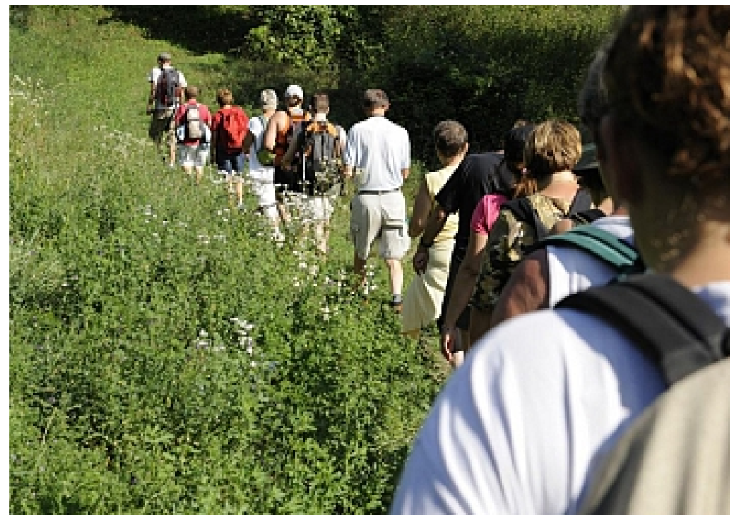
Office de Tourisme de Brides-les-Bains