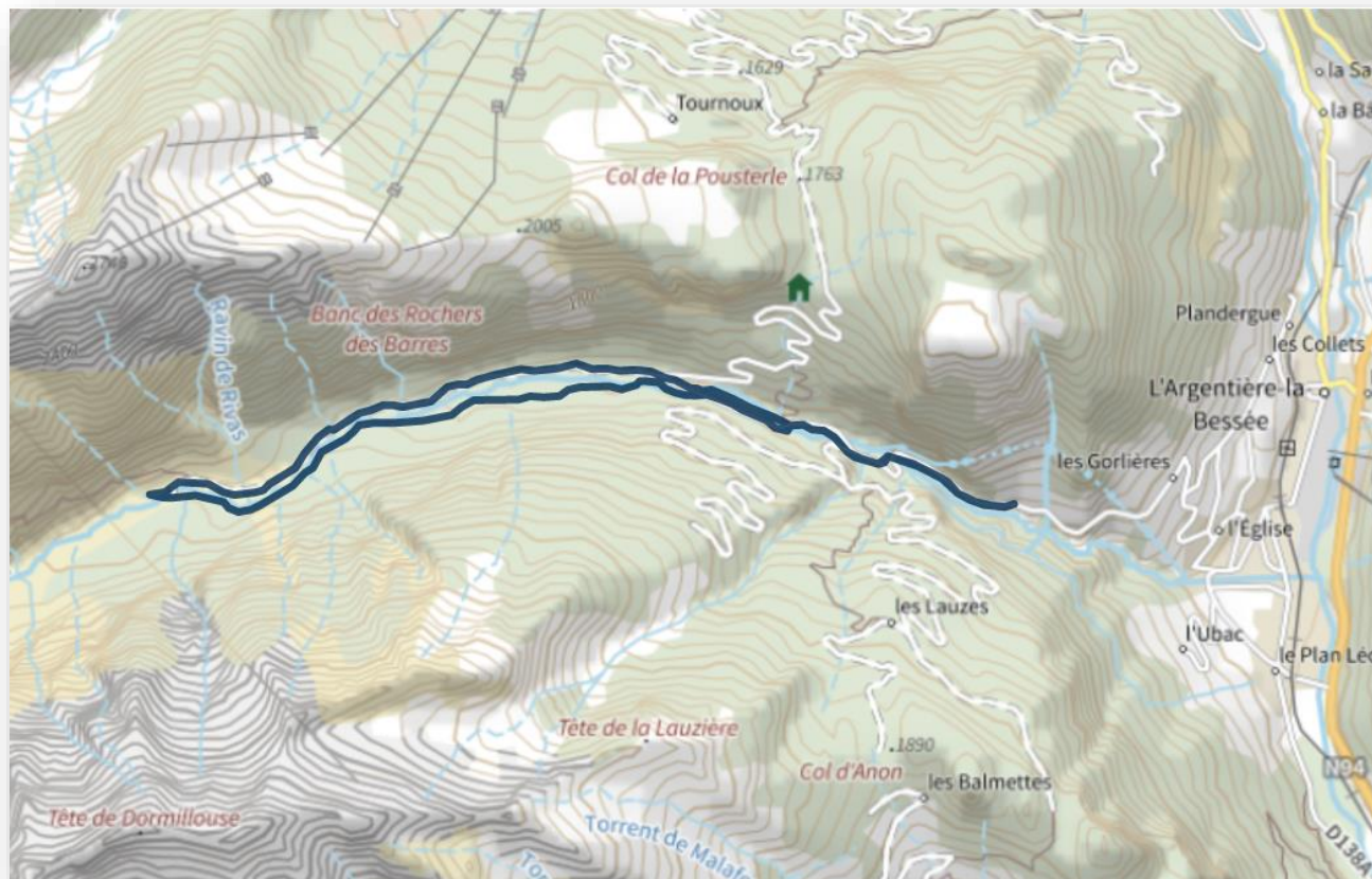
Détail du trek sur Carte