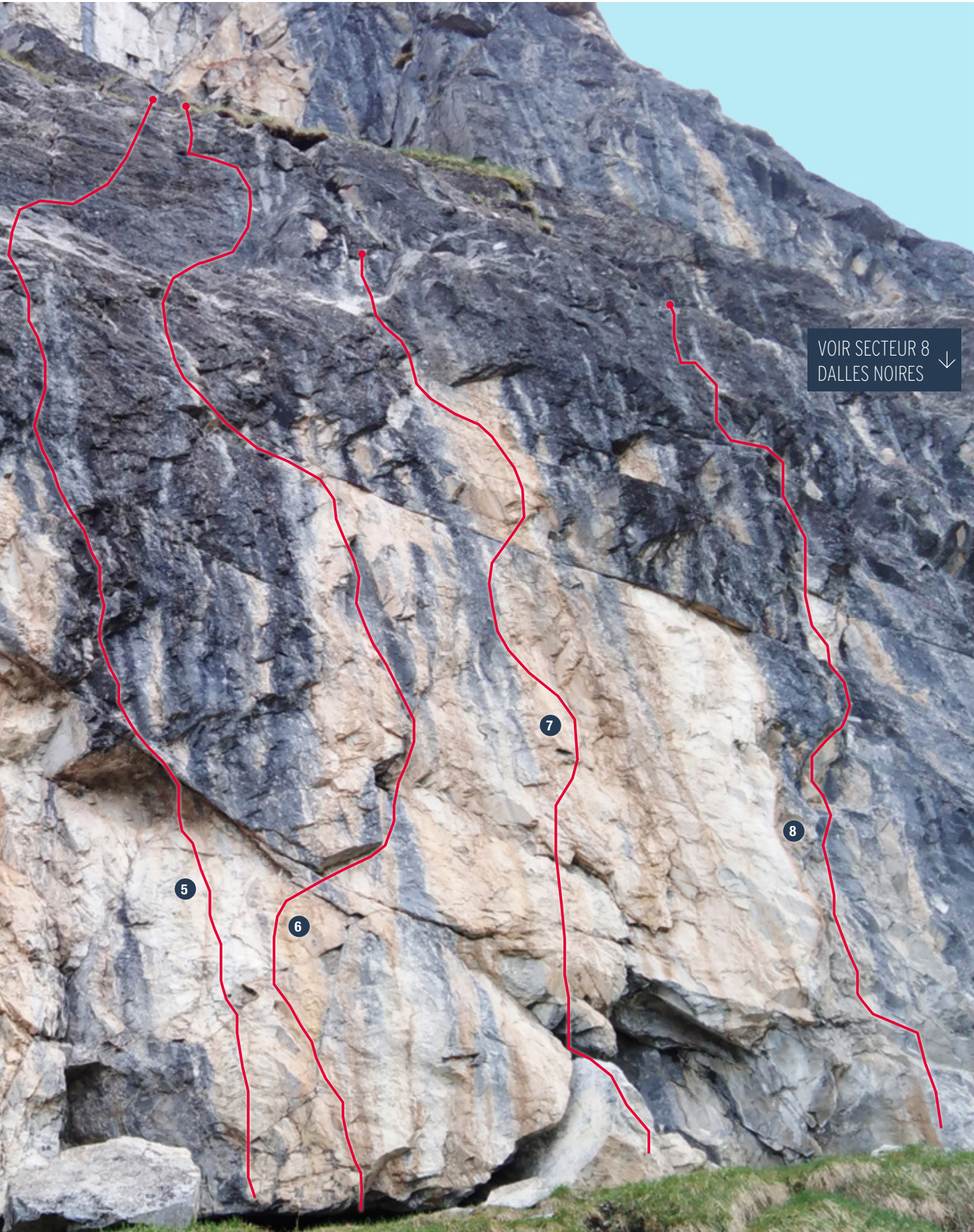
5 Violet profond • 7b+/7c 6 Bijou des alpages • 6c 7 Sacrée paire de doigts • 7a+ 8 Oh my gode ! • 6c