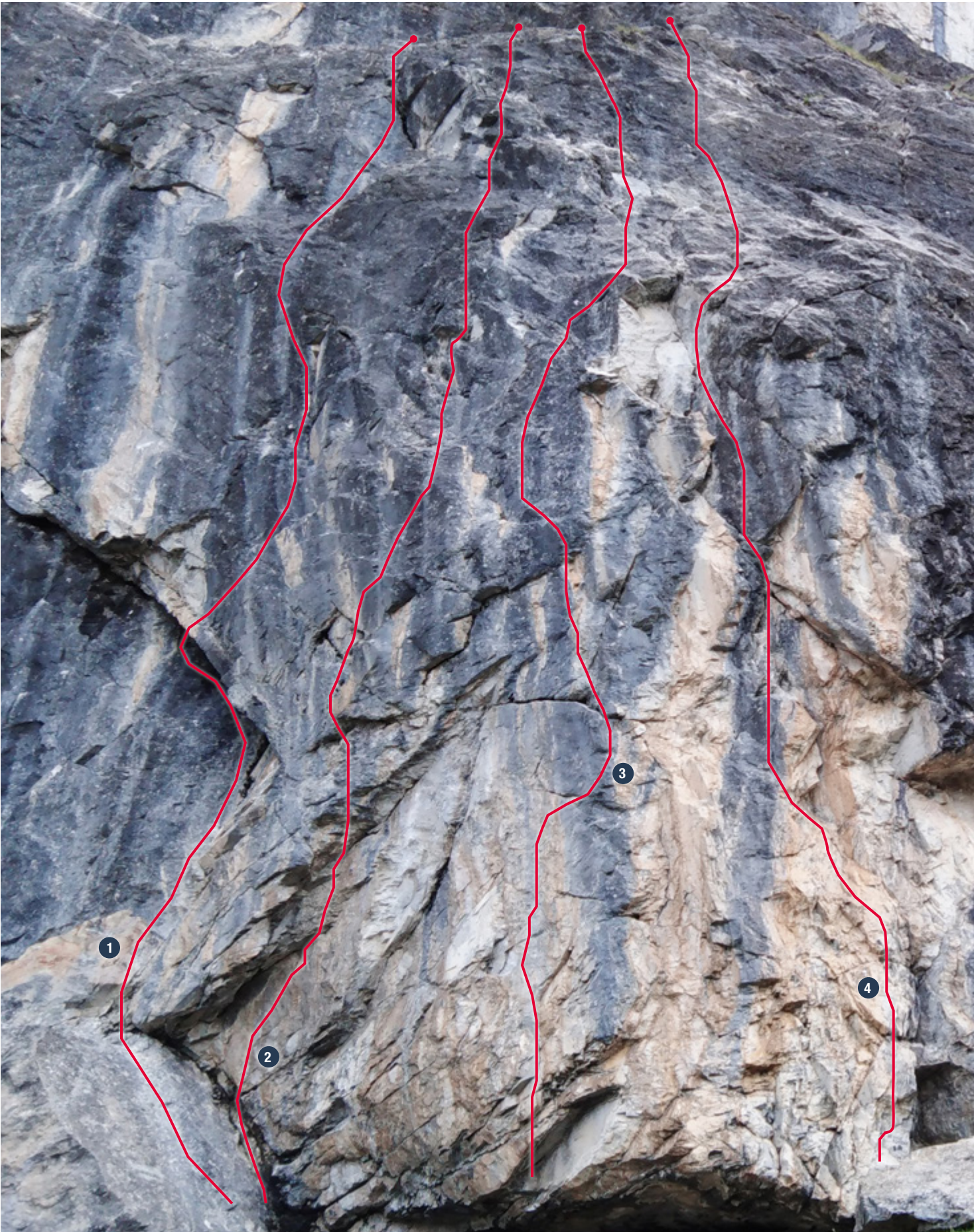
1 Enduit d'erreurs • 7a 2 Alphanticide • 7a+ 3 Rose fluide • 7b 4 Orange Tonique • 7a