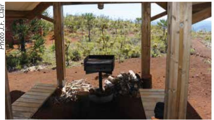
Refuge du Mont Do - Espace barbecue