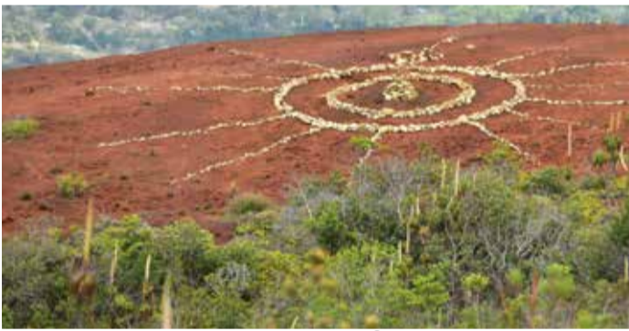
Land Art : oeuvre de Steeve Pwere (Point 7)