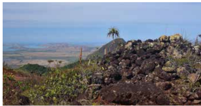
Cairns du Mont Do (Point 6)