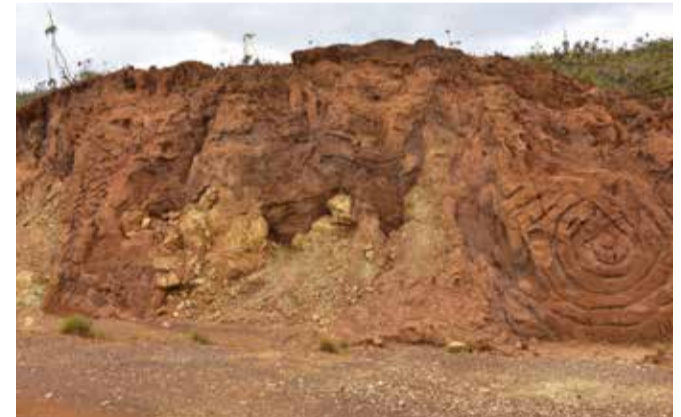
Land Art : oeuvre de Patrice Kaikilekofe Point 8