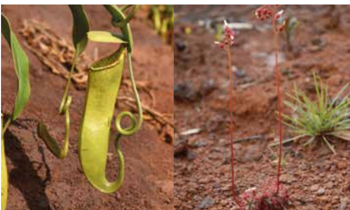
Plante carnivore (Nepenthes Vieillardii) Plante carnivore (Drosera neocaledonica)

Les Drosera , autres plantes « tueuses », produisent un leurre de nectar destiné à attirer les insectes à l'extrémité de leurs petits poils rouges. Fatale méprise! Ils s'engluent et s'épuisent rapidement. Les Drosera replient alors ces poils et produisent un suc très actif qui leur permet de digérer leur victime vivante.