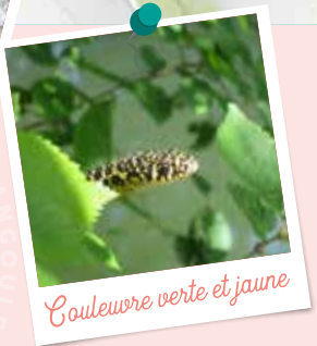
Couleuvre verte et jaune