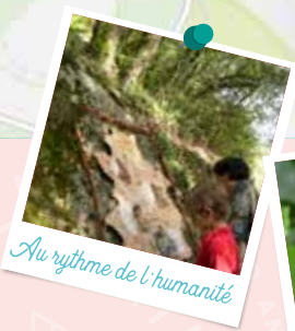
Au rythme de l'humanité