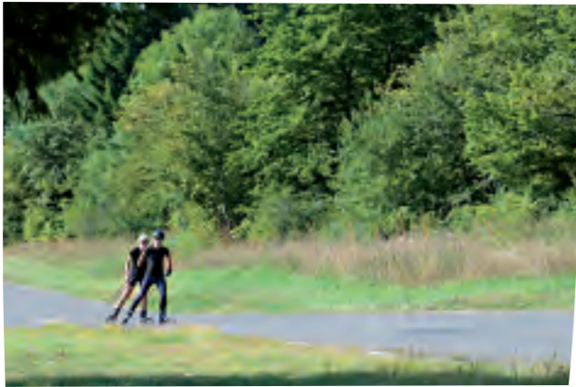
L'été dans le Valromey, il n'est pas rare de croiser des biathlètes en train de s'entraîner avant la saison hivernale.