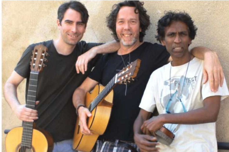
Un voyage musical autour du monde avec le Trio Cavalcade à l'affiche le mercredi 19 mars.