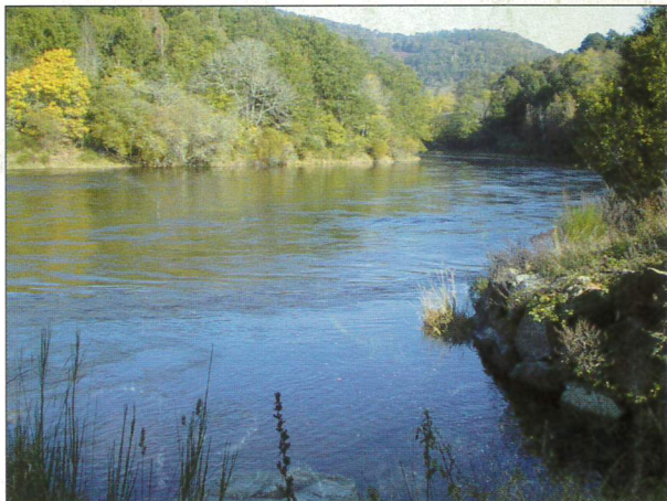
C'est ici que le remontalou se jette dans la truyère

A partir de la PR vous pourrez également voir la digue du Barrage de Lanau ainsi que sa retenue. Plus petit que son grand frère Sarrans, il est classé dans la catégorie "éclusées", il a une productivité moyenne.