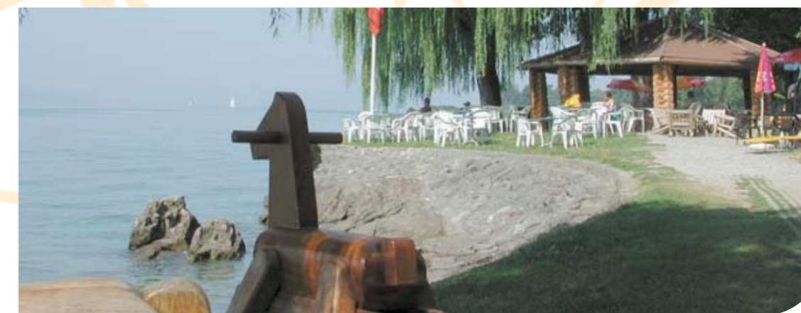
La Tour de Peize

L'éruption disparaît sans laisser de traces en 10 à 20 jours.