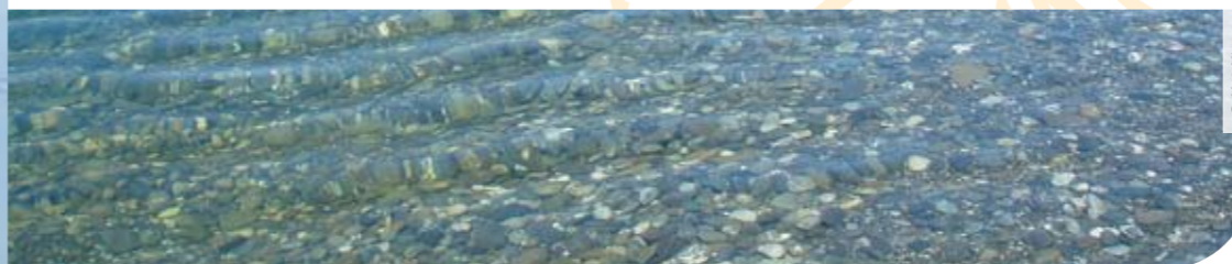
B. Mark Mehta

Les plages du Léman sont pratiquement toutes favorables à la baignade. Au large, à plus de 50 mètres de la rive, l'eau du lac est partout de bonne qualité pour la baignade. Elle n'est toutefois pas potable sans traitement.