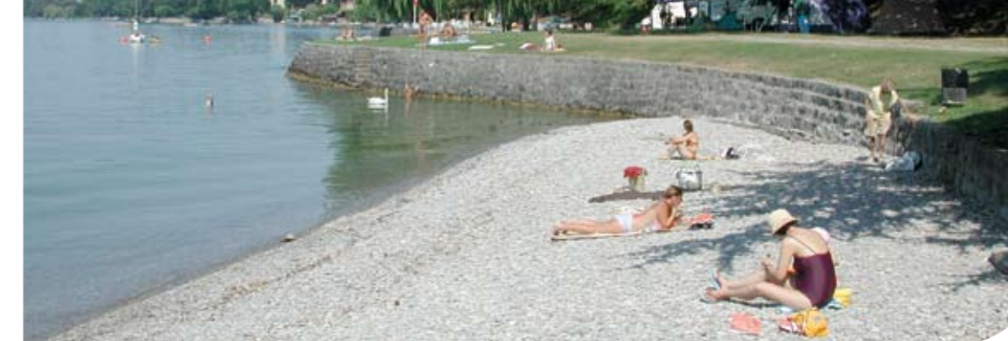
La Tour de Peize

Tout au long de l'année, la qualité de l'eau d'une plage peut varier. Une pollution temporaire peut se produire en raison d'un déversement d'eau souillée près de la plage. Les quelques endroits qui font problème de manière chronique sont ceux qui sont proches de rejets de stations d'épuration ou d'embouchures de cours d'eau pollués. Les sites proches de déversoirs de délestage du réseau d'eaux usées (déversoirs d'orage) peuvent être pollués de manière plus sporadique, particulièrement après de fortes pluies.