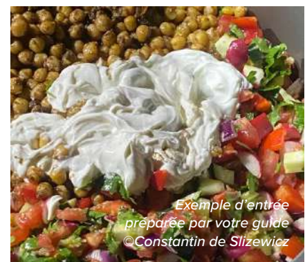
Exemple d'entrée préparée par votre guide