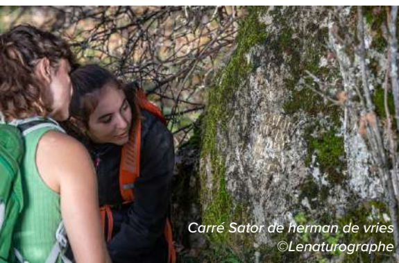
Carré Sator de herman de vries