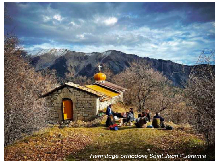
Hermitage orthodoxe Saint Jean