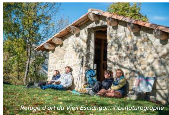
Refuge d'art du Vieil Esclangon.