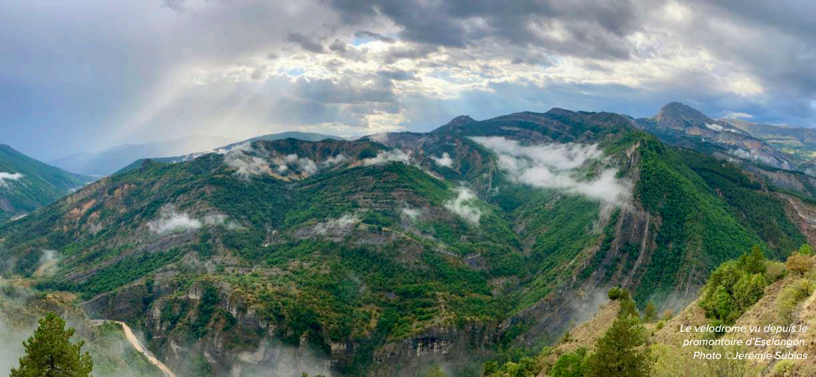
Le vélodrome vu depuis le promontoire d'Esclangon.