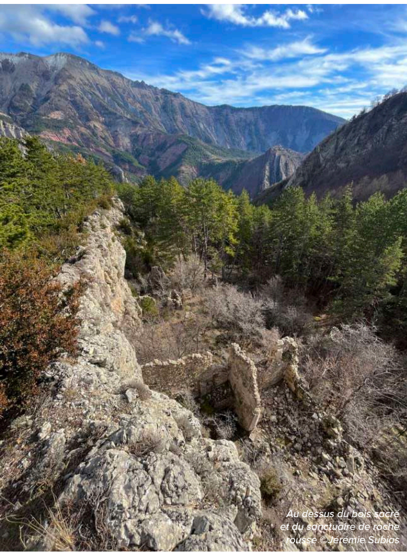
Au dessus du bois sacré et du sanctuaire de roche rousse