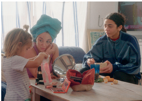
Fille de Lili Cazals - Projection et discussion - Soirée Marseilles ! Jeudi 20 mars à 20h30 au cinéma La Baleine.

Le Festival Tous Courts, festival international de court métrage à Aix-en-Provence, fêtera sa 43 e édition en décembre 2025. Ouvert au plus grand nombre, très investi auprès du public jeune, il assure chaque année, la promotion du court métrage et participe à l'émergence des talents de demain, avec près de 200 films diffusés dont plus de 70 en compétition.