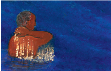
Papillon de Florence Miailhe – Masterclass consacrée à la réalisatrice de films d'animation Florence Miailhe. Jeudi 20 mars à 14h30 au cinéma Les Variétés.

Plus d'information : www.descourtslapremidi.fr