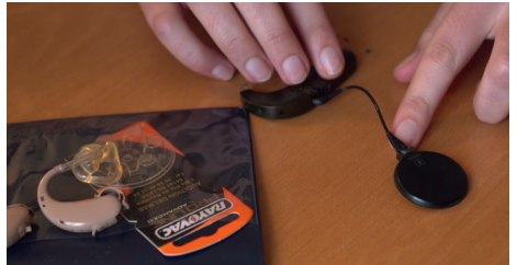
Bonjour les entendants de Miren Dupouy – Projection Carte blanche au collectif Lundi soir. Vendredi 21 mars à 20h30 au Vidéodrome 2.