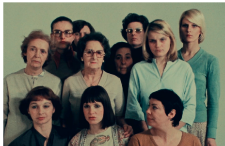
Réponses de femmes d'Agnès Varda - Projection Les femmes par les femmes; Vendredi 21 mars à 14h30 à la Maison de Quartier La Mareschale à Aix-en-Provence.

Lorsque les femmes tournent la caméra vers elles-mêmes : tour d'horizon des documentaristes et essayistes des années 70-80.