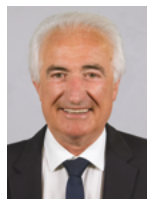
Marcel Cattaneo Conseiller départemental du canton de Faverges-Seythenex