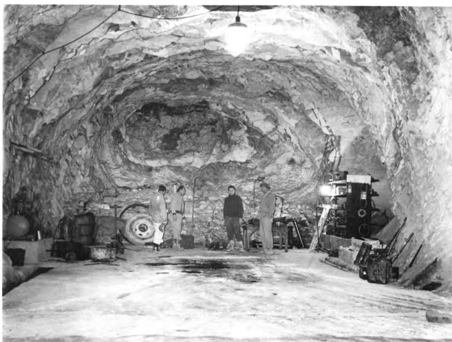
Exploitation souterraine du gypse de Saint-Pierre Les Martigues

Par cuisson du gypse (sulfate de calcium hydraté ( \text{SO}_4\text{Ca}, 2\text{H}_2\text{O} )), à faible température (70 à 95°), on obtient le plâtre ( \text{SO}_4\text{Ca}, 1/2\text{H}_2\text{O} ). Celui-ci a pour propriété de durcir à l'air, en récupérant son eau. Le plâtre est utilisé comme liant. Il sert également à réaliser des moulages ou des cloisons préfabriquées.