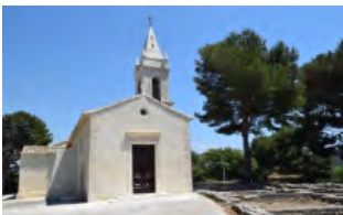
L'église de Saint-Pierre et le début de l'oppidum à droite

C'est aussi l'emplacement d'un site archéologique dont les vestiges sont connus depuis le XIXe siècle. Plusieurs campagnes de fouilles, étalées entre les années 1970 et les années 2000, ont permis de mettre en évidence une occupation continue du site depuis la Préhistoire jusque vers 50 ap. J.-C. La période gauloise reste la plus importante avec la présence d'un oppidum, une agglomération fortifiée, constituée de centaines de maisons à pièce unique, bâties en pierres et briques crues, organisées en îlots le long de rues étroites sur toute la butte, soit 1,5 hectares.