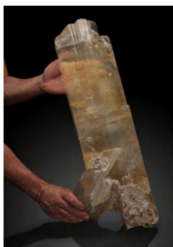
Cristaux de gypse

• En 1989, l'exploitation est définitivement arrêtée par manque de rentabilité et risques géotechniques. A l'arrêt des travaux certains étages d'exploitation ont été remblayés.