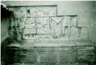
Vue du bas-relief pris dans le mur extérieur de la chapelle

Elle existe depuis le Moyen-Age mais a été en partie reconstruite au XIXe siècle par la famille Demandolx-Dedons qui possédait le château d'Agut. Dans sa façade nord, est encastré un bas-relief gallo-romain en pierre de la Couronne, appartenant probablement à un mausolée monumental. Il représente une scène familiale à caractère funéraire, daté du Ier s. ap. J.-C. En relation avec une villa de la même époque, située à quelques centaines de mètres de là, ce bâtiment honore le premier maître et fondateur du domaine résidentiel et agricole de Saint-Julien. Symbole de la romanisation de Martigues, il exprime l'intégration des élites locales dans un nouveau système politique et social. Depuis 1923, il est classé au titre des Monuments Historiques.