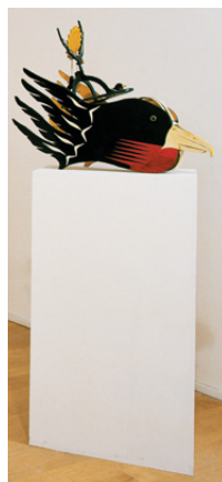
Ken Thaiday, Sr Oiseau frégate (de l'ensemble Hammer Head Shark), 2000 © Blaise Adillon

Dim. 15 février 10 h à 13 h • 14 h à 17 h