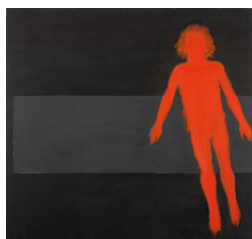
Judith Reigl, Hors, Oh gioia l'oh ineffabile allegrezza ! (série Hors), 1998