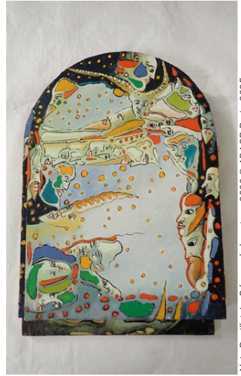
Alain Pouillé, La Déesse de la nature, 2000 © ADAGP, Paris, 2025