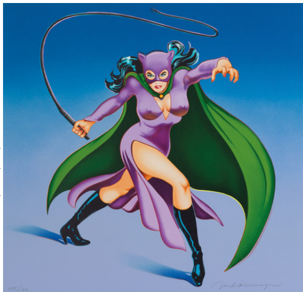
Mel RAMOS, Cat Woman #1 © 2025 Estate of Mel Ramos, ADAGP, Paris, 2025