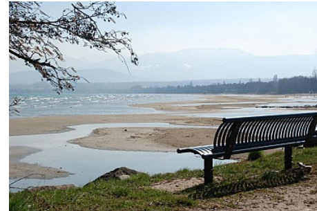
J Favrat Vaudaux

Lors de crues ou de fortes pluies, des fluctuations peuvent cependant survenir et augmenter le niveau du lac d'environ 30 cm.