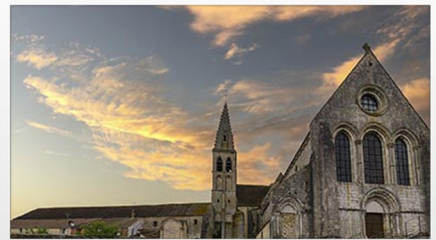
Visite de la Cité Médiévale de Ferrières-en-Gâtinais