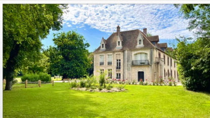
Visite de l'Abbaye de Cercanceaux à Souppes-sur-Loing