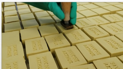
Visite de la Savonnerie Arthur à Sceaux-du-Gâtinais

Votre choix est fait, appelez-nous ! 01 64 29 38 08