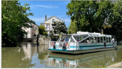
Croisière sur le canal de Briare de Montargis à Amilly