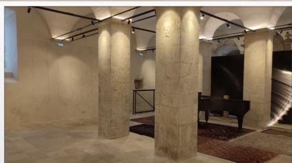
Visites de l'Hôtel-Dieu et de la Maison de la pierre à Château-Landon