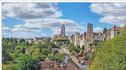
Visite de la Cité Médiévale de Château-Landon

L'Office de Tourisme Gâtinais Val-de-Loing vous propose d'organiser votre sortie culturelle d'une journée ou à la carte avec un suivi personnalisé, une réactivité et des prestataires de qualité. Toutes les propositions sont modulables. Faites-nous part de vos envies, nous établirons ensemble une programmation sur mesure.