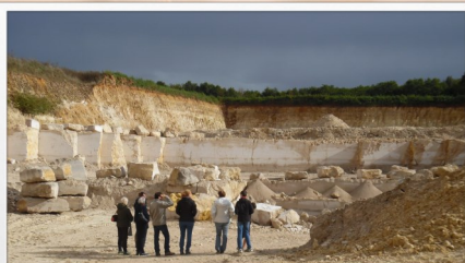
Visite des Carrières de Souppes-sur-Loing