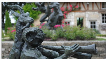
Visite du Jardin Musée Bourdelle à Egreville