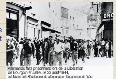
Allemands faits prisonniers lors de la Libération de Bourgoin et Jallieu le 23 août 1944