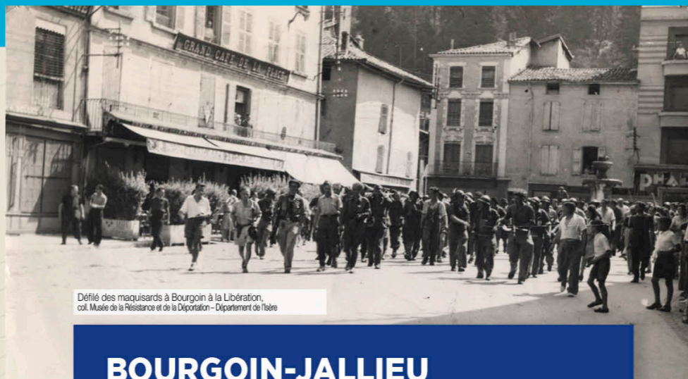
Défilé des maquisards à Bourgoin à la Libération