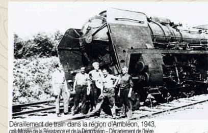
Déraillement de train dans la région d'Amboise, 1943, col. Musée de la Résistance et de la Déportation - Département de l'Isère