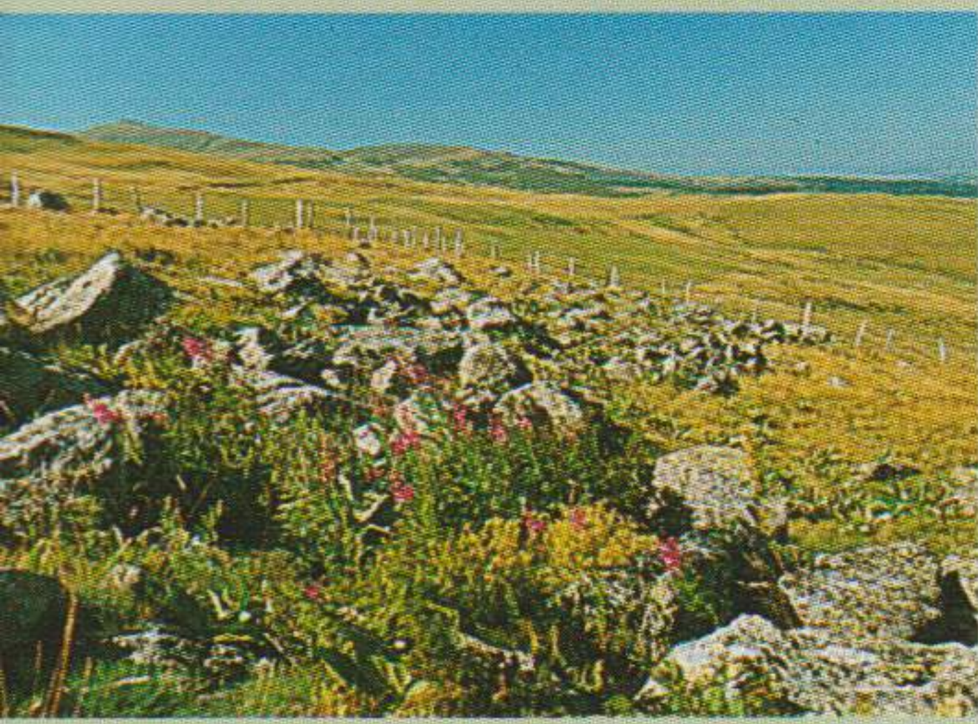
Vue sur les Monts du Cantal

prendre en face un chemin. Après une pâture et un passage à gué, il arrive à Recoules. 7 Arriver au village de Recoules, prendre une route à droite sur 100 mètres puis suivre le chemin sablé à gauche sur 500 mètres. 8 Laisser sur votre gauche le lieu-dit la Rode et prendre un chemin à droite puis un autre à gauche. 9 Un aller-retour est possible jusqu'au promontoire en contre-haut sur la gauche, (table d'orientation) vue sur Oradour, la Margeride, l'Aubrac et les Gorges de la Truyère. Descendre à Chabanne. En arrivant, prendre à droite des bâtiments agricoles. Après le hameau, s'engager à gauche dans un sentier qui débouche sur la route à l'entrée d'Oradour. 10 Sur la droite, la fontaine et le travail à ferrer et noter plus haut, l'église gothique avec sa tour carrée (XI e s).