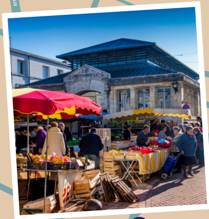
MOULINS DES GORCES

La construction de l'église du Sacré-Cœur remplace un ancien temple protestant qui servait aux offices catholiques et devenu vétuste.