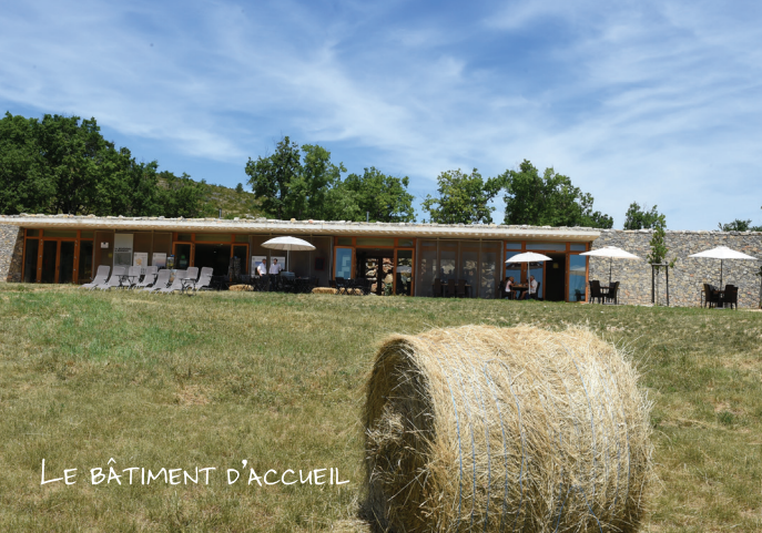
LE BÂTIMENT D'ACCUEIL