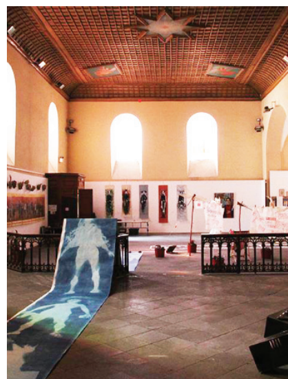
La visitation

Brioude est également devenue un haut lieu de l'art moderne avec l'ouverture du Doyenné . Ce centre d'art moderne et contemporain propose des expositions d'envergure internationale mettant en valeur des artistes du XX ème siècle comme Chagall (2018), Miró (2019), Nicolas de Staël (2021) ou encore Picasso (2022) et contemporain avec l'exposition d'Ernest Pignon-Ernest en 2023. Elle accueille chaque année en moyenne 35 000 visiteurs sur sa période d'ouverture, entre les mois de juin et d'octobre.