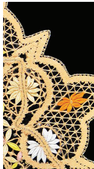
Hotel de la dentelle