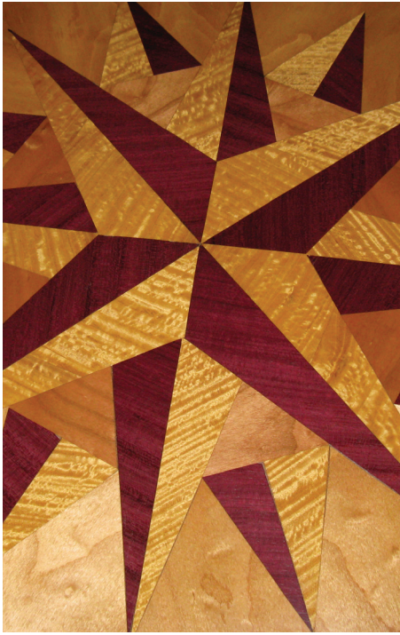
Atelier de Rochely