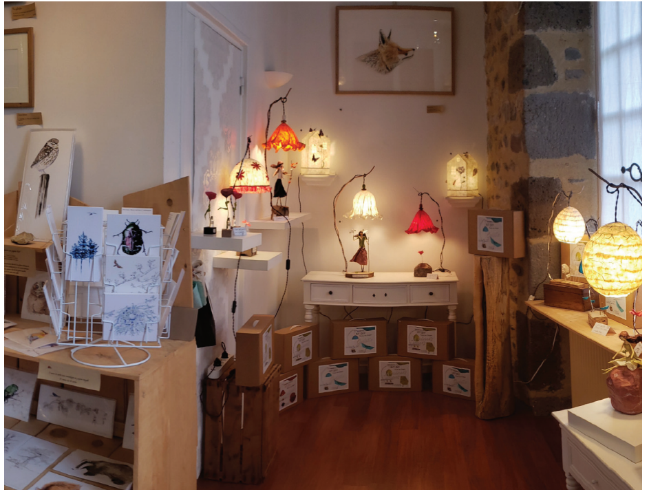
Boutique Reg'Art d'Ateliers

Pour participer à ce salon, vous devez :