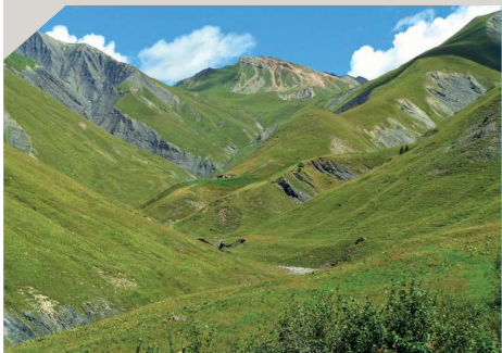
La Platière - Vallon des Faverottes