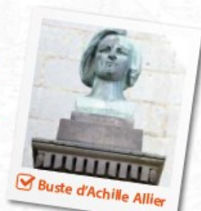
Buste d'Achille Allier