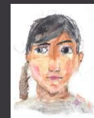
Dessin d'enfant ©Essra