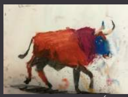
Dessin d'enfant ©Éléna