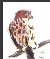
Dessin d'enfant ©Lucas