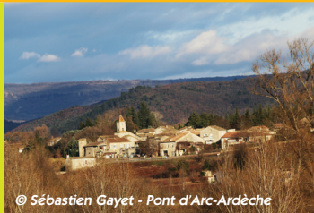
© Sébastien Gayet - Pont d'Arc-Ardèche

Départ : St-Maurice-d'Ardèche Coord. GPS : N44°31'19,1" / E4°24'01,2" Distance : 4,6km Durée : 1h30 Dénivelée cumulée : 127m Balisage : blanc et jaune (PR)