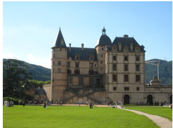
Le Château de Vizille

La Réunion des Etats généraux du Dauphiné, également appelée Assemblée de Vizille, s'est déroulée le 21 juillet 1788 dans la salle du Jeu de paume du Château de Vizille. Elle a réuni les trois ordres du Dauphiné sur l'invitation de son propriétaire, l'industriel Claude Perier. Cette assemblée réunie six mois avant la convocation des États généraux de 1789 a été le prélude à la Révolution française. Depuis 1984, un musée départemental consacré à la Révolution française a été créé dans le Château de Vizille. Il propose une collection unique d'œuvres d'art en rapport avec cette période de l'histoire, de la fin de l'Ancien Régime à la Troisième République.