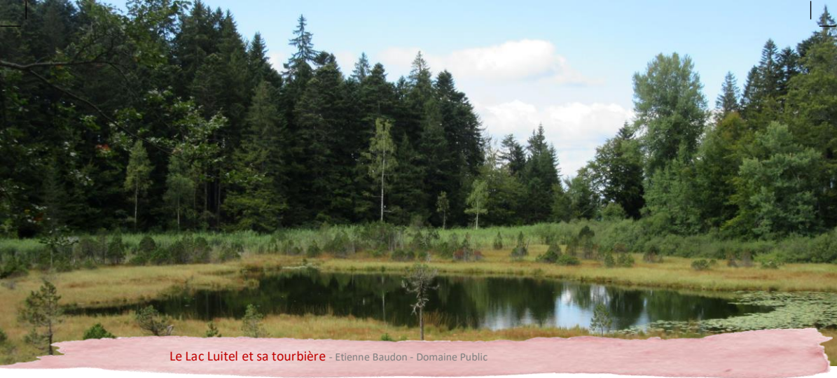
Le Lac Luitel et sa tourbière - Etienne Baudon - Domaine Public