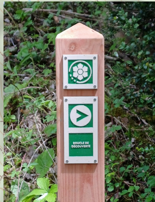
ENS Marais du Pravet